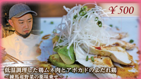
低温調理した鶏ムネ肉とアボカドのよだれ鶏 ~練馬産野菜の葉味乗せ~