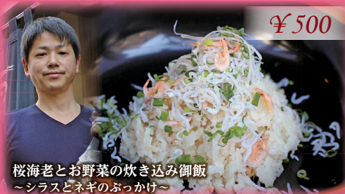
桜海老とお野菜の炊き込み御飯 ~シラスとネギのぶっかけ~