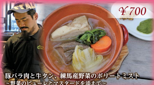
豚バラ肉と牛タン、練馬産野菜のポリートミスト ~野菜のピューレとマスタードを添えて~