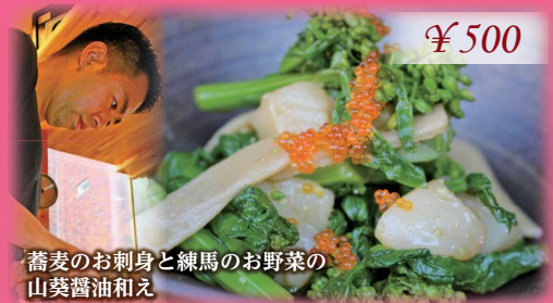
蕎麦のお刺身と練馬のお野菜の 山葵醤油和え