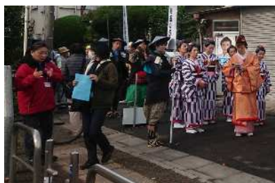
練馬大根献上絵巻 再現劇