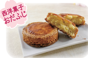
西洋菓子 おだんご