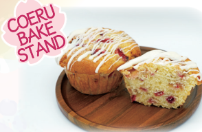
COERU BAKE STAND