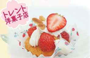
トレント 洋菓子店