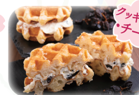
クッキング チーズ