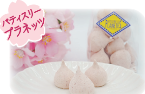
パティスリー ブランネット