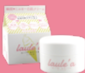
美心舎 ハンドクリーム など

出演時間 ①10時30分～ ②12時30分～ ③14時30分～ (各回10分程度)