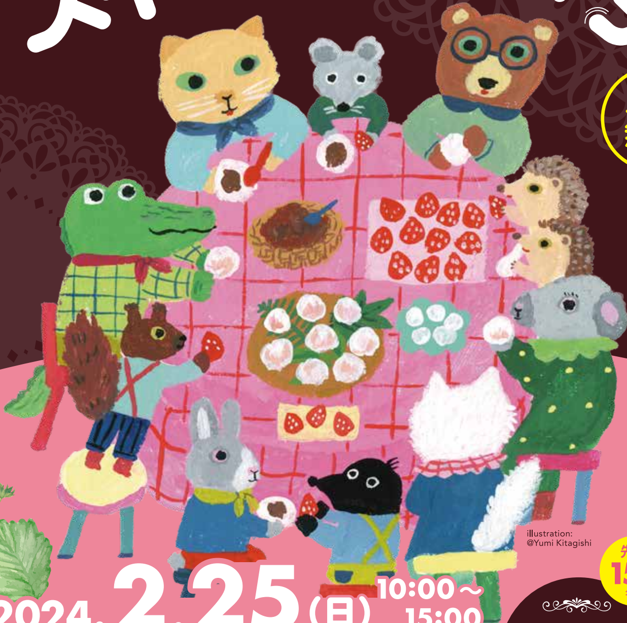
illustration: @Yumi Kitagishi