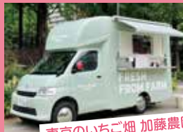
東京のいちご畑 加藤農園 いちごミルクスムージー など