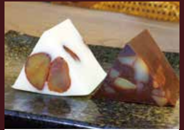
和菓子大吾 和菓子大吾