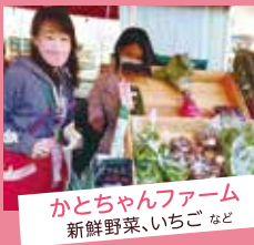
かとちゃんファーム 新鮮野菜、いちご など