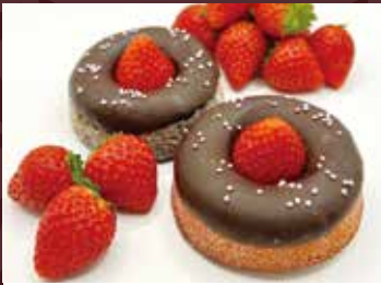
西洋菓子おだふじ