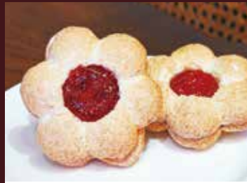
パティスリープラネッツ