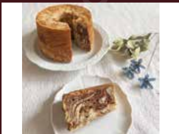
アトリエシュクレ