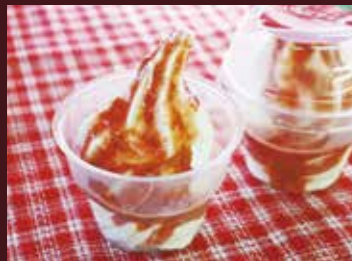
トレント洋菓子店