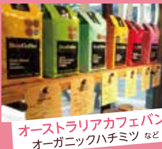
オーストラリアカフェパン オーガニックハチミツ など