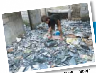
※廃家電の不適正処理の現場（海外） 有害物質が環境中に放出。