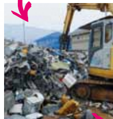
右下：違法に集められた 廃家電スクラップの火災 が、全国で頻発。