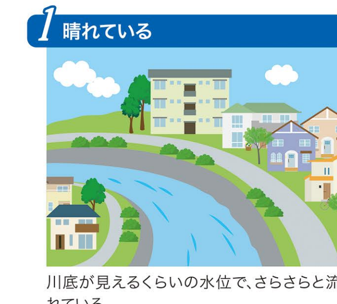
川底が見えるくらいの水位で、さらさらと流れている。