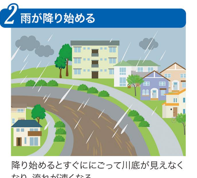
降り始めるとすぐににごって川底が見えなくなり、流れが速くなる。