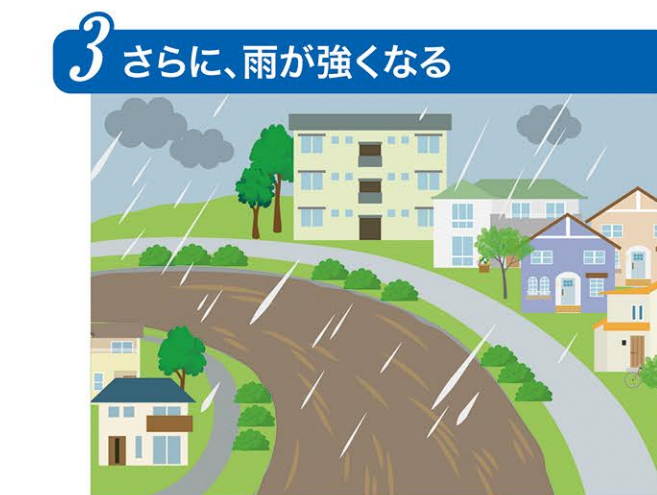
川に水が集まり、地面の高さまで水位が急上昇する。