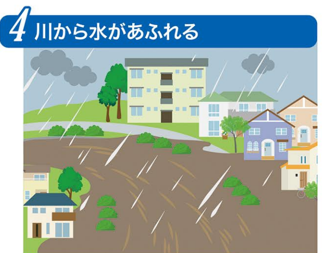
川が氾濫し、川沿いの住戸が浸水する。