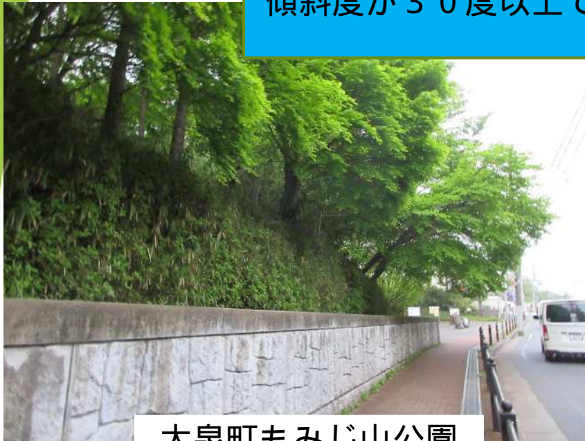
大泉町もみじ山公園