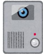
カメラ付きインターホン