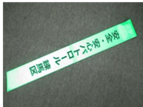
夜行たすき (5ポイント)