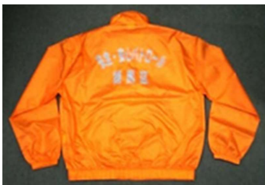
夜行ジャンパー (10ポイント)