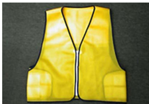
夜行ベスト (10ポイント)