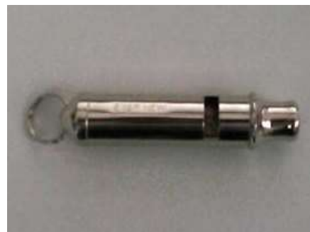
ホイッスル (1ポイント)