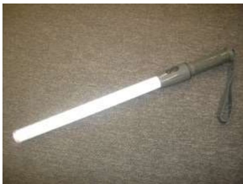
誘導電灯 (10ポイント)