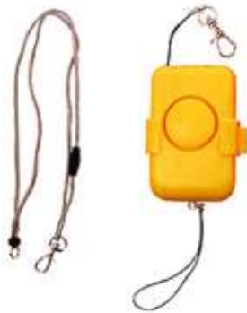
防犯ブザー (4ポイント)