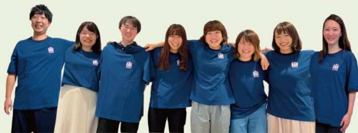
講師：iii project (トリプルアイプロジェクト)

東日本大震災のとき、当時中学生3年生で、現在は千葉県旭市を拠点に震災経験を語り継ぐ活動を行っている「iii project (トリプルアイプロジェクト)」の方を講師としてお招きし、東日本大震災の被災経験をうかがいます。