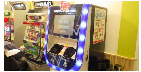
メダルを預ける機械（生体認証付き）

長い子だと2,3時間いる子もいます。よく来てくれる子は、メダルを貯めて持っている子が多く、お金をたくさん使わずに遊べるので、通ってくれています。メダルは店外への持ち出しは禁止ですが、メダルを預ける機械に預けて貯めておくことができます。