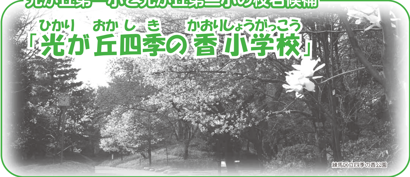
練馬区立四季の香公園