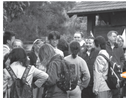
ホストファミリーとの出会い

6回の事前研修では、英会話の学習が印象に残っています。始めは、恥ずかしくてなかなか声が出せませんでした。少人数で学習して、自然に英語を話せるようになりました。また、派遣生としての積極性も学びました。