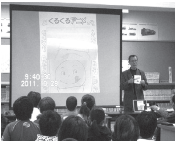
プロのアニメーターを招いた授業風景(石神井東小)

昨年度は、10校でアニメを活用した授業を行っており、石神井東小学校の第6学年では総合的な学習の時間にプロのアニメーターを講師として招き、実際にアニメを制作する授業を行いました。