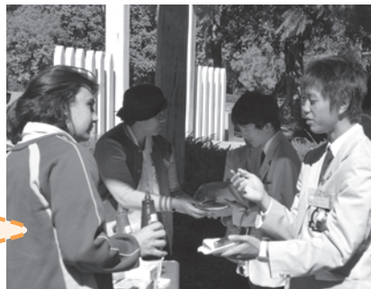
スクールパディとの交流

6日間ホームステイでお世話になったホストファミリーの皆さんは、オーストラリアでしかできない経験をさせてくれ、常に温かく接してくださいました。派遣生にとって、ホストファミリーは第二の「家族」となりました。