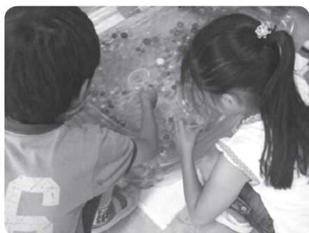
たくさんとれるかな?