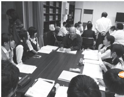
事前研修の様子(英会話学習)

6回の事前研修では、英会話の学習が印象に残っています。始めは、恥ずかしくてなかなか声が出せませんでした。少人数で学習して、自然に英語を話せるようになりました。また、派遣生としての積極性も学びました。