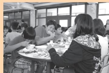
一緒に給食を食べました