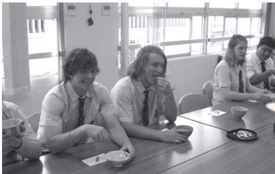
体験授業(茶道)：貫井中