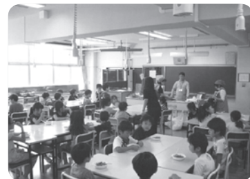
おいしくいただきます!

小学校内の敷地に畑のある開進第一小学校応援団では、いちようひろばの子供たちが協力をしてじゃがいも掘りをしました。当日はどんより曇り空でしたが、何とか天気ももってたくさんのじゃがいもが掘れました。掘ったじゃがいもは、翌日、スタッフが作ってくれたカレーライスの中に。子供たちは自分で収穫したじゃがいもを味わうことができ、貴重な体験だったと思います。