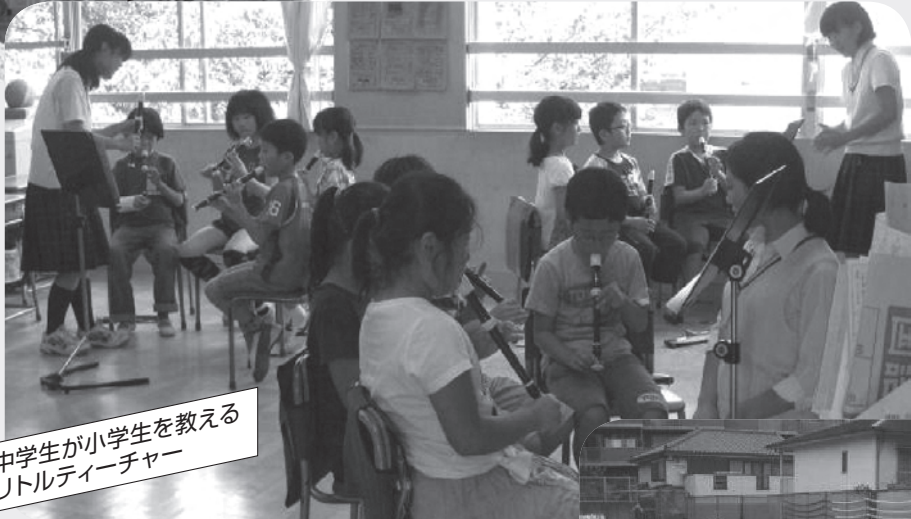
中学生が小学生を教えるリトルティーチャー

練馬区の小中一貫教育 小・中学校の先生が協力して、9年間を見通した教育を行います。合同の授業研究や交流などにより、子供たちの学習意欲や自己肯定感を高め、すべての子供たちが安定した学校生活を送れることを目的としています。