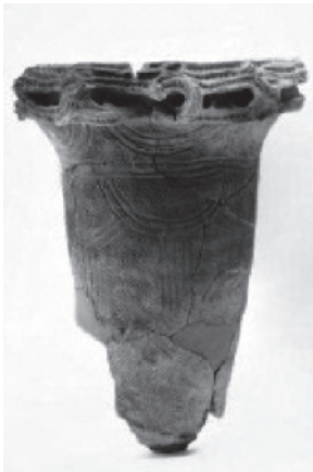
北新井遺跡 縄文土器(中期)

【問合せ】 地域文化部 文化・生涯学習課 伝統文化係 [電話 5984-2442]