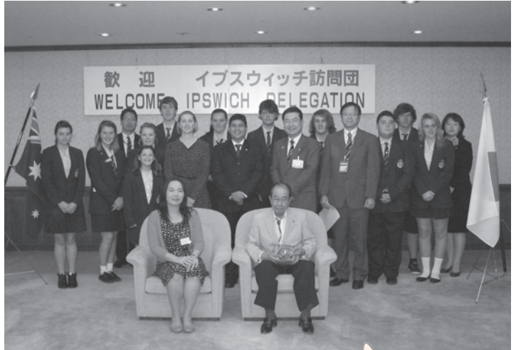
区長表敬訪問の様子

また、28日(金)には区長表敬訪問の後、貫井中学校、光が丘第三中学校において体験授業を行い、練馬区の中学生等と交流を深めました。夕方には歓迎パーティーが開催され、関係者との交流を深めることができました。