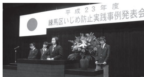
「平成23年度いじめ防止実践事例発表会の様子」

平成25年1月には、「平成24年度いじめ防止実践事例発表会」を開催し、いじめ防止に向けて、小・中学校の授業や幼稚園の保育において実施した活動や児童会・生徒会が主体となって実施した活動、保護者・地域と連携して実施した活動について発表し、各校(園)の取組に生かしていきます。