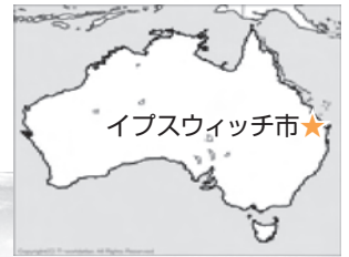
イブスウィッチ市★

練馬区では、毎年、友好都市提携を結んでいるオーストラリア・イブスウィッチ市に区立中学校生徒68人(各校2人)を派遣しています。派遣生は事前に6回の研修会に参加し、英会話練習をはじめ、日本とオーストラリアの文化や産業、ホームステイ家庭でのマナーなどを学習し、練馬区の親善大使として海外派遣に臨みました。