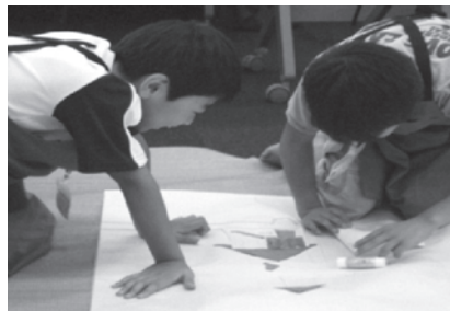
自宅の周辺や町の特徴を 地図に書き込んでみよう

最後の修了式では、一人一人に修了証が手渡されました。1日図書館長と図書館員からは、「また来年も参加したい」「来年は読み聞かせをしたい」との感想が聞かれました。