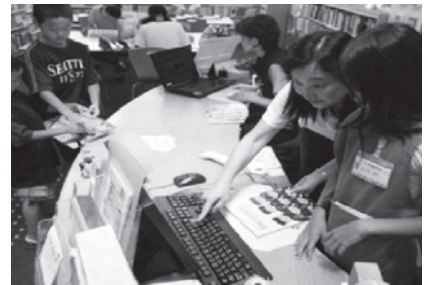
カウンターで戻ってきた本を 返却処理してみよう