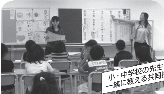
小・中学校の先生が一緒に教える共同授業

練馬区の小中一貫教育 小・中学校の先生が協力して、9年間を見通した教育を行います。合同の授業研究や交流などにより、子供たちの学習意欲や自己肯定感を高め、すべての子供たちが安定した学校生活を送れることを目的としています。