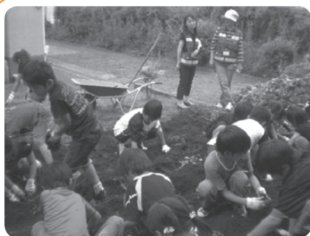
みんなで協力して掘ぞ!

地域の方が中心となって、放課後の児童の遊び場の確保・異年齢児の交流・読書の推進を図る組織「学校応援団」。シリーズ第5弾は夏休み前のイベント取材した2つの学校応援団を紹介します。