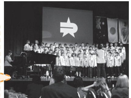
派遣団による全員合唱

受け入れてくださったオーストラリアの方々への感謝の気持ちを伝える「さよならパーティー」では、「ふるさと」など3曲を披露しました。私たちの歌声の響きに対して、参加された方々の感動を得ることができました。