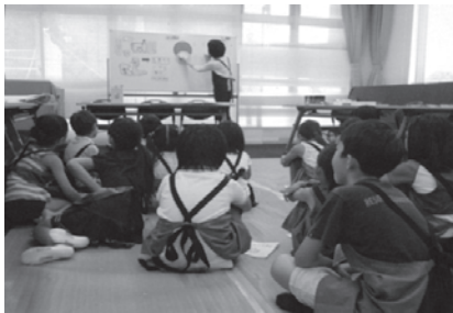
図書館の本の分類って どうなっているのかな？

当日、実習用エプロンに身を包んだ可愛い図書館員が集合し、自己紹介の後、参加者の中から1日図書館長を任命しました。午前中は、日本十進分類など図書館の本の分類の仕方の講義を受け、配架(本を元の棚に戻す作業)と書架整理、返却処理の作業などを行いました。