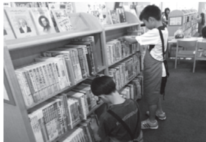
本をさがしやすいように ていねいに並べよう