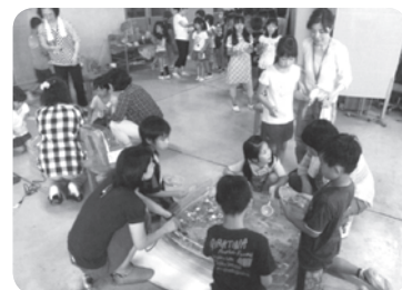
水そう2つでも大行列ができました。

大泉学園緑小学校応援団では、暑い日にスーパーボールすくいをしました。縁日でも大人気なスーパーボールすくいなので、順番を待つ子供たちでひろばの周りは大行列ができていました。流れも強弱をつけて2種類あり、どの子も楽しく遊んでいました。中にはカップにあふれる程取れた子もいました。