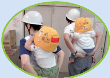
0歳児クラスはいざという時のためにざらしおんぶを経験します

光が丘第三保育園では、年間を通して地震や火事など、様々な時間帯で発生することを想定した実践的な防災訓練を行っています。職員は、子ども達の命を守るため、発災時や日常における安全確保について、学び、話し合いを行っています。また、子ども達も自ら身を守る力をつけられるように訓練を行っています。その一例を紹介します。