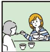
障がいや病気のある家族の身の回りの世話をしている。