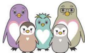
東京都里親制度PRキャラクター「さとペン・ファミリー」

里親制度について知りたい方、里親になることをお考えの方など、ぜひご参加ください。