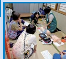
看護師による心肺蘇生