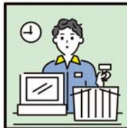
家計を支えるために労働をして、障がいや病気のある家族を助けている。