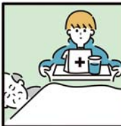
がん・難病・精神疾患など慢性的な病気の家族の看病をしている。