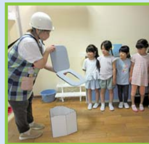
災害用トイレについて学びます