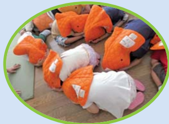
幼児クラスの子供達は大事な頭を守る訓練を行っています