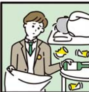
アルコール・薬物・ギャンブル問題を抱える家族に対応している。