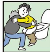
障がいや病気のある家族の入浴やトイレの介助をしている。