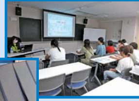
防災学習センターでの園内研修