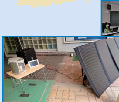
蓄電池の作動確認