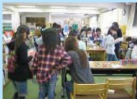
「本の探検ラリー」の様子

問題を解いてスタンプを集めると「本の探検家認定証」がもらえるよ。通っている学校で開催されたときには、ぜひ参加してみよう!