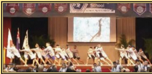
【ソーラン節の披露】