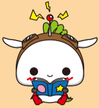
練馬区公式アニメキャラクターねり丸