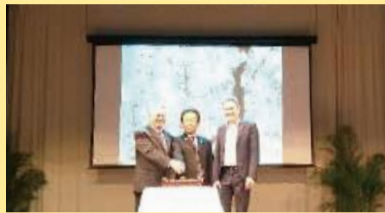
【25回目の交流を記念したケーキカット】