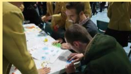
【日本文化を伝えるワークショップ】