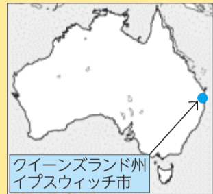
クィーンズランド州 イプスウィッチ市