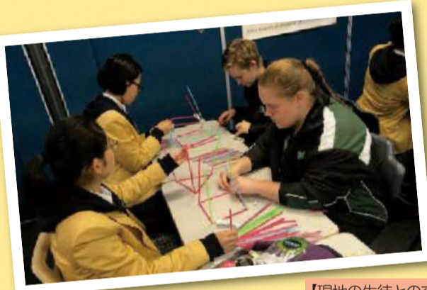
【現地の生徒との交流】