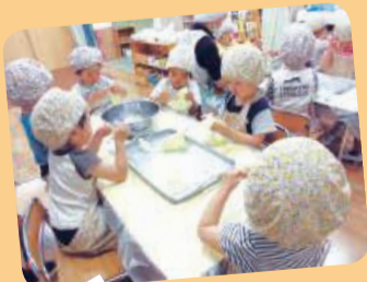
調理さんのお手伝い! サラダを作るために キャベツをみんなできぎるよ

食にかかわるいろいろな活動を通して、子供たちが食べ物に興味を持ち、食事が楽しくおいしく感じ、そして食への感謝の気持ちを育てていくのだと感じています。