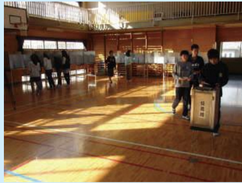
本格的な投票所を再現