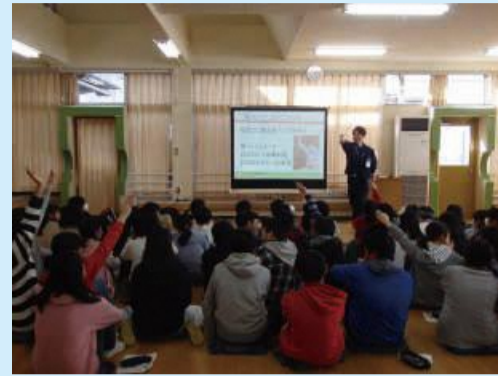
アクティブラーニング形式の講義