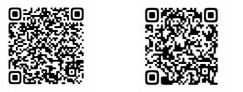
工程表のダウンロード その他の説明会資料等は

○ 土曜日・日曜日については原則休工とし、4週8休で工事を行う計画としています。 なお悪天候等により休工となった場合は、一部の作業を土曜日に振替えて行う場合があります。 また、祝日については工事の進捗状況によっては一部の作業を行う場合があります。 振替え等で作業を行う場合には、事前にHP (下記工程表URLから) にてご案内します。 ○ 4/29祝日については工事進捗により作業を行います。 ○ 2/25、3/3・4・10を雨天により休工としたため、4/4・11・18・25への振替えを行います。 ○ パークマンション前の道路については、4月も引き続き工事車両の通行が増加します。 ○ 大型車両の通行については、9:00~17:00の間に断続的に往来があります。 ○ 5月の月間工程表は4月最終週に掲載予定です。 ○ 現場作業員については、交代制にてシフトを組み、労働時間上限の枠内で作業を行うようにします。