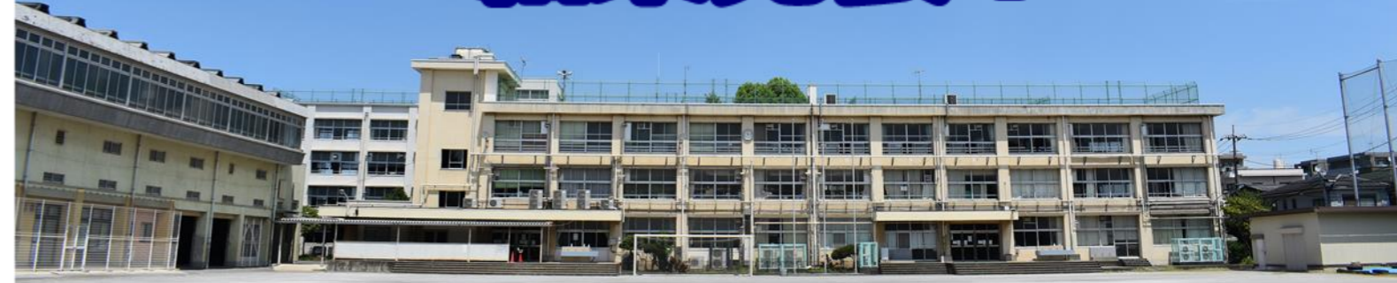
アンケートは旭丘中学校の通学区域である旭丘・小竹地域に配布しました