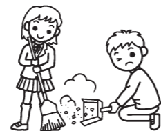
小学生と中学生が合同で地域クリーン運動