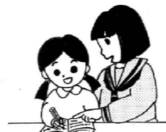
中学生がリトルティーチャーとして小学生の学習を補助