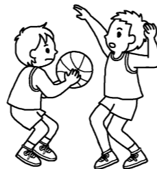
小学生が中学校の部活動体験