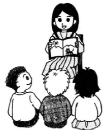
中学生が小学生に本の読み聞かせ