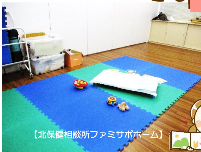
【北保健相談所ファミサポホーム】