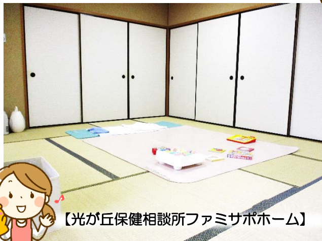
【光が丘保健相談所ファミサポホーム】