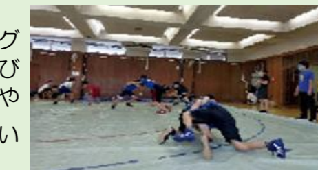
全国大会で優勝もしました

SSC 谷原の傘下で練馬区唯一のジュニアレスリングのクラブです。オリンピック種目としても注目を浴びるスポーツです。クラブでは幼児のうちから柔軟性や敏捷性を養い怪我をしない体づくりを大切にしています。現役や往年のアスリートの訪問も時々あり、刺激を受けながら週2回の練習をしています。