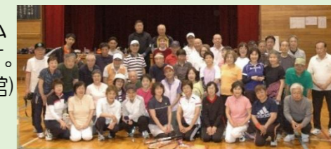
和気あいあいと練習しています

開進第四小学校と小竹小学校の体育館開放をホームコートとして活動するラケットテニスのチームです。写真はコロナ禍前に主催した大会（於小竹小体育館）でお招きした練馬区他チームとの集合写真です。楽しくやっています！