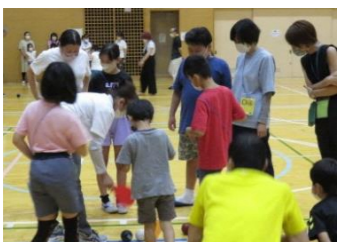
どちらが勝っているか、みんなで確認だ！