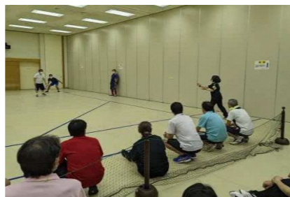
委員が皆で「Baseball 5」を体験中

今回は6/25に行われた「ニュースポーツ研修会」でした。紹介されたのは「Baseball 5 (ベースボールファイブ)」で、ひと言で言えば5人制の野球です。最低10人集まればゲームが出来、使用道具はボールのみという手軽さからか野球やソフトボールが行われていなかった地域でも急速に普及しています。2026年ダカールユースオリンピック(2022年から延期)の公式種目に追加されました。参加した委員からは、競技についてより知識を深め、普及に尽力したいと感想がありました。