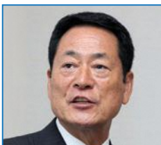
中畑 清 (なかはた しみず) さん 元読売ジャイアンツ選手 横浜DeNAベイスターズ前監督