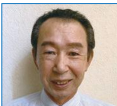
篠塚 和典 (しのづか かずのり) さん 元読売ジャイアンツ選手 野球解説者