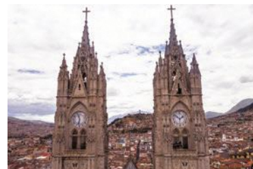
キトのバシリカ教会

なんべい 南米にある 赤道直下の国です。 有名なガラバゴス 諸島はエクアドル 領です。