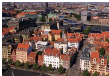
コペンハーゲンの街並み