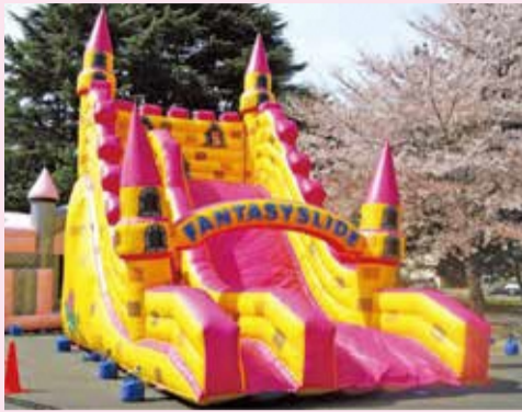
体協スライダー体験