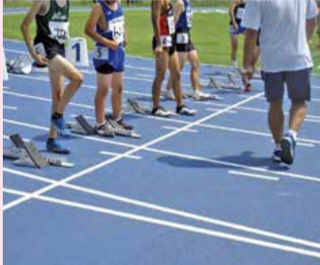
スターティングブロック タイム計測 様々な体験ができます。

問合せ (公社)練馬区体育協会 TEL:5393-5420 FAX:5393-5425