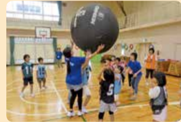
スポすい・ひろば

「わんぱくキャンプ」や「スポすい・ひろば」などを実施しています。「わんぱくキャンプ」では自然と親しみ同年の仲間との交流を深めること、「スポすい・ひろば」ではスポーツを通して、競技種目への興味と楽しさを感じてもらうことを目的としています。子どもたちの健やかな成長にスポーツの果たす役割は大きいと考えています。今後とも、練馬区でのキッズスポーツの振興に、積極的に関わっていきたいと思います。