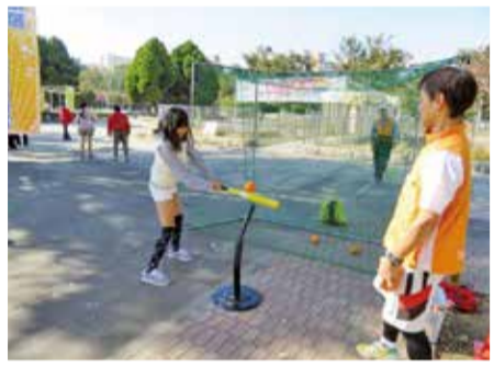
ねりすぽフェスティバル