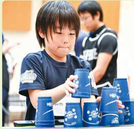
スポーツスタッキング

練馬区レクリエーション協会は、スポーツスタッキング協会に協力し、キッズスポーツの普及に努めています。スポーツスタッキングとは、複数のプラスチック製カップを、決められた型に積み上げたり崩したりして、そのスピードを競うスポーツです。競技としてのルールも細かく確立されており、年齢・体力・性別を問いません。1985年頃にアメリカ合衆国・南カリフォルニアで、子供達が紙コップで遊んでいた事から発祥しました。子供から高齢者まで楽しめるスポーツをぜひ体験して下さい。