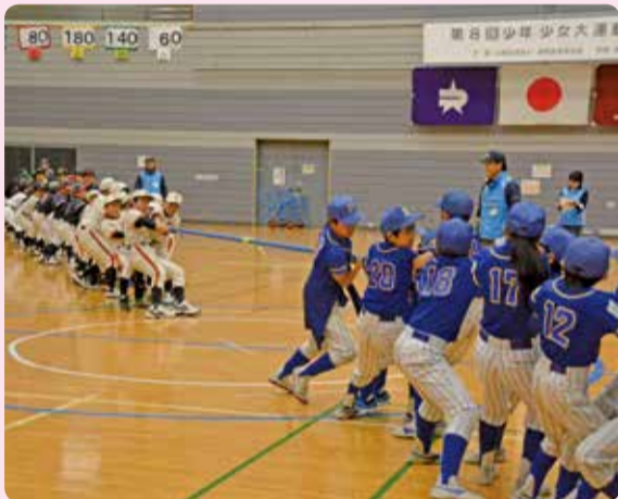
大綱引き(少年少女大運動会)

少年少女大運動会を毎年秋に開催しています。昨年は500名が参加しました。ジュニア育成の一環として、種目にこだわらず子どもたちが、自由に気楽に運動を楽しむことができる機会を作ることを目的としています。会場は光が丘体育館、対象は小学3～6年生となっており、大玉送り・玉入れ・大綱引き・台風の目・敏しょう性リレー・障害物競走等楽しい種目がいっぱいなので是非ふるってご参加ください。