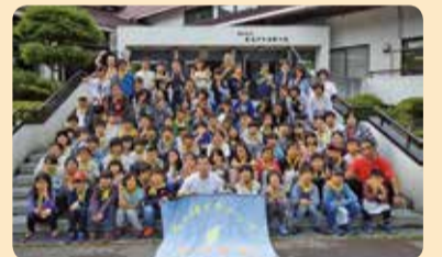
わんぱくキャンプ