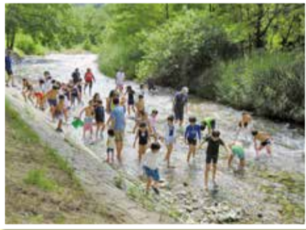
わんぱくキャンプ