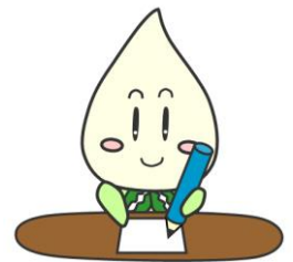
ねりまの生涯学習 マスコット「らぼ」