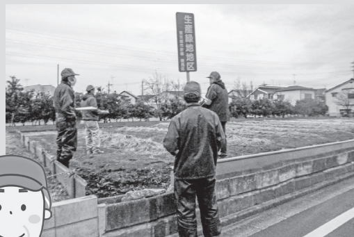
▲ 委員による農地パトロールの様子