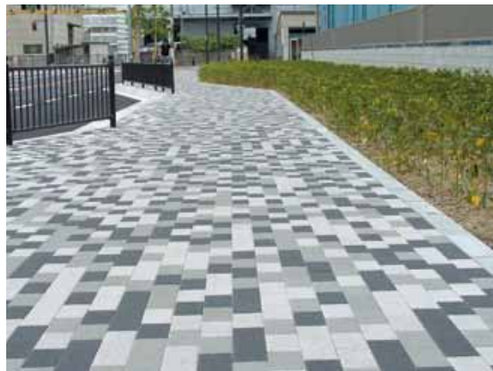
【インターロッキングブロック】