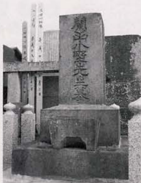
移設された小野蘭山墓

小野蘭山は延享元年（一七四四）、16歳で松岡恕庵から本草学を学ぶ。宝暦3年（一七五三）に私塾を開き、多くの弟子を輩出した。寛政11年（一七九九）71歳で江戸に移り、幕府の医学館で本草学を講じた。享保元年（一八〇一）から文化2年（一八〇五）まで、幕府の命で諸国へ採葉旅行に行き、その結果を書物にまとめている。特に、享和3年（一八〇三）出版の『本草綱目啓蒙』は、後の博物学の発達にも大きな影響を与えた。