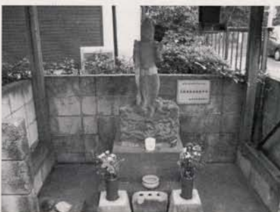
丸彫青面金剛庚申塔

・申込方法 往復はがきに、①住所・②氏名・③電話番号・④希望のコースをご記入のうえ、各実施日の10日前までにお申込ください。 (複数コースご希望の場合、1コースにつき1枚の往復はがきが必要です。) (※希望者多数の場合は抽選します。) ・参加費 1コースごとに保険料10円を当日集めます。 ・申込先 練馬区郷土資料室 〒177-0045 練馬区石神井台1-16-31 電話03-3996-0563 (月曜休室)