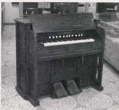
なつかしい音色がよみがえる

※入場券は①チケットぴあ(057010219999)、②練馬文化センター(399313311)、③イトーシンミュージック(355711720)でお求めください。②・③は窓口販売のみ。