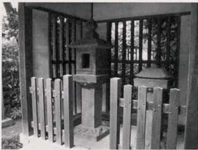
豊島氏奉納の石燈籠