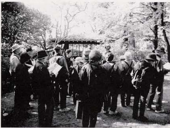
昨年の文化財めぐり(大泉学園駅出発コース)

本号で紹介の「リードオルガンコンサート」は、ねりま区報9月1日号に、「文化財めぐり」や「石神井城跡巡り」の参加方法などは、ねりま区報10月11日号に掲載します。