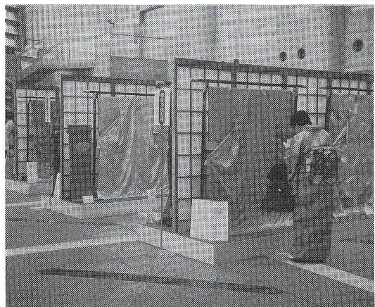
アトリウムでの展示(昨年度)

今年の練馬区伝統工芸展は、11月2日(金)から4日(日)まで、区役所アトリウム地下多目的会議室などで開催されます。区内伝統工芸の力作を展示するほか、制作の実演、体験や相談コーナーなども設けます。