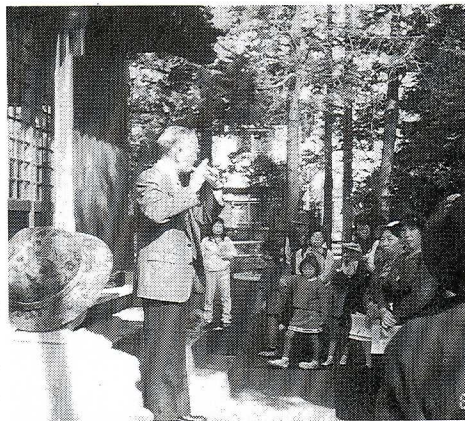
秋の史跡散歩(お囃子の実演)