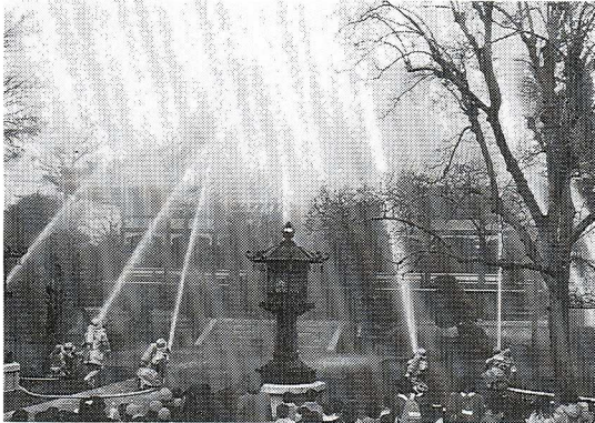
消火訓練(平成元年1月26日 春日町 愛染院境内)

昭和24年(1949)1月26日に、奈良の法隆寺金堂壁画が火災により失われたことをきっかけとして、毎年この日に全国