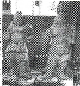
▶ 服部半蔵奉納の仁王像