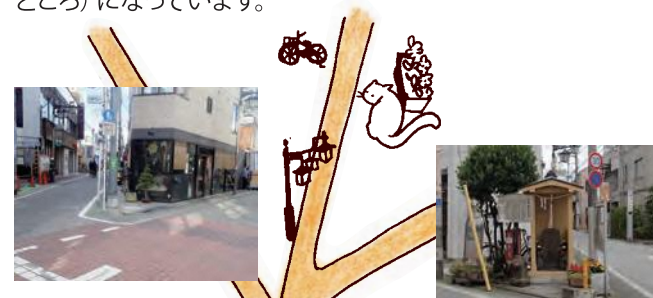
角におもてを向けたお店

江古田駅から環七通りに向かって延びる江古田ゆうゆうロードは、そこから次々とY字路が現れて、まちが広がっている通りです。Y字の交差点には、道の角へ正面を向けるお店や庚申塔があり、印象的なアイススポット (視線が集まる場所) になっています。