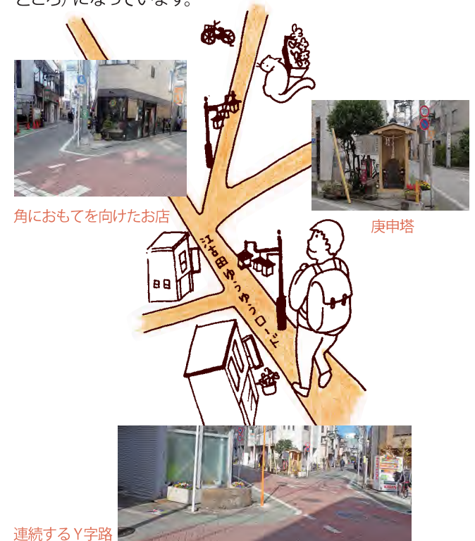
角におもてを向けたお店

江古田駅から環七通りに向かって伸びる江古田ゆうゆうロードは、そこから次々とY字路が現れて、まちが広がっている通りです。Y字の交差点には、道の角へ正面を向けるお店や庚申塔があり、印象的なアイスポット (視線が集まる場所) になっています。