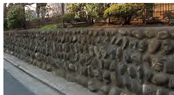
大泉二小の石垣は、練馬大根をたくあんにつけていた漬け物石で築かれています。