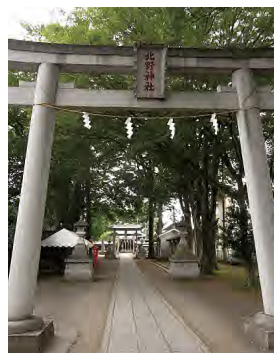
正面の参道は平坦です。

大泉学園駅の北口からほど近いところに北野神社があります。大泉街道から平坦に延びる参道が特徴ですが、大泉小学校の校庭から神社の背後を見ると、一段高い台地の縁に立っていることがわかります。このあたりは白子川の河岸段丘であることを物語っています。