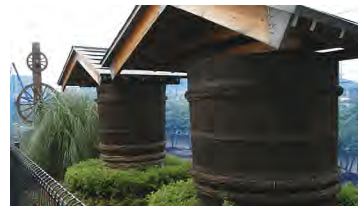
永井農園には、漬け物樽が飾られています。

漬け物樽や大泉第二小学校の石垣など、大泉の農風景を感じるしつらえや、小さな工夫があちこちにあります。探しながら歩くのも楽しみのひとつです。