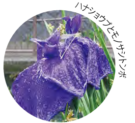
ハナショウブ(アモジヤンタ)