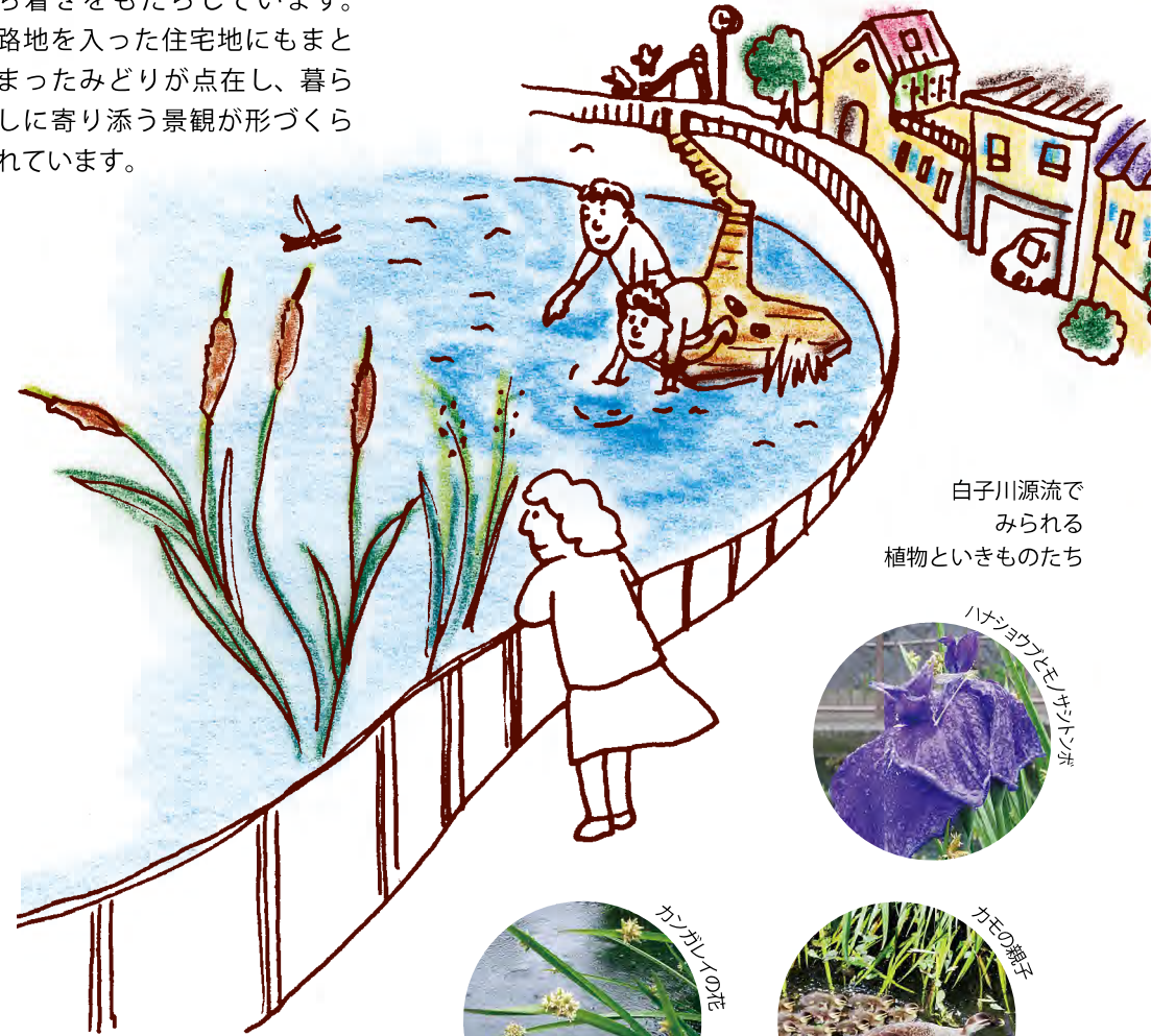
白子川源流で見られる植物といきものたち

白子川の源流が流れる大泉井頭公園は、川の曲線に沿って造られた公園です。公園を取り囲むように住宅が立ち並び、水面の近くまで降りて水と親しむことができる特別な空間です。