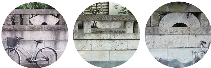
同じ素材(大谷石)で作られた幾何学模様の塀。何パターンあるでしょう？

さくらの辻公園の東側は、かつて石神井川が蛇行していた流域部のヘリにあたります。この辺りは、河川改修に伴って宅地開発された住宅地です。塀をよく見ると、様々な模様を見つけることができます。