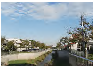
旧早稲田通りから水路敷を辿ると、石神井川の開けた眺望が見えます