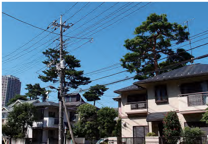
斜面地に立ち並ぶ立派な松は、地域の特徴を伝える景観要素です

石神井川の流域跡の道から、北側の斜面を見上げると立派な松が何本も立っています。昔から松が自生していた武蔵野台地で、川の名残と松がつくる石神井の原風景を垣間見ることができます。