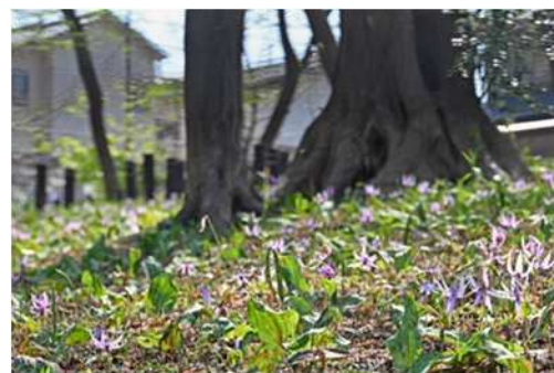
清水山の森のカタクリ群生地