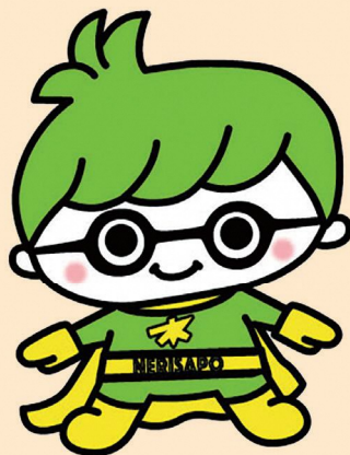
練馬ビジネスサポートセンター公式キャラクター「さぼっとくん」