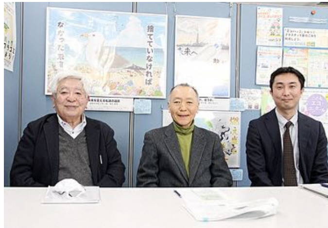
お話を伺った3名。左から横倉会長、小口事業部会長、柴田事務局長