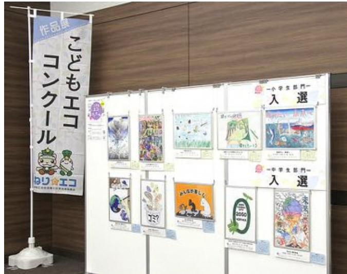
「こどもエコ・コンクール」の入賞作品はイベント会場や区役所アトリウムなどに展示されます