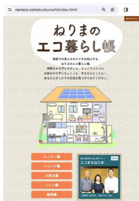
「ねりまのエコ暮らし帳」