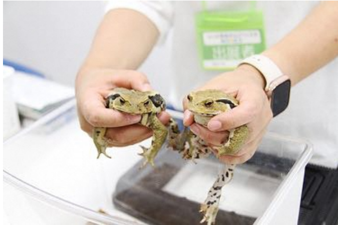
練馬区立中里郷土の森緑地ブースの「触れるいきもの展示」