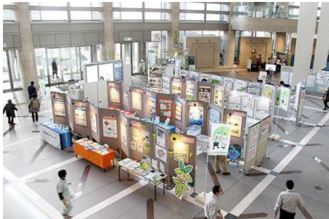
毎年2月に区役所アトリウムで開催される「スタート！エコライフ」（2023年の様子）。企業や団体のブース展示から、環境に関する取り組みを知ることができます

横倉「CO 2 の排出は規制がないので、排出者にとってはともしれば出したもの勝ちというのが現状です。炭素税のようにCO 2 の排出量に応じて税金をかける、あるいは排出権取引といって、割り当てられた排出量の枠を超えた分は取引で埋める。こういうことが具体的に議論されています」