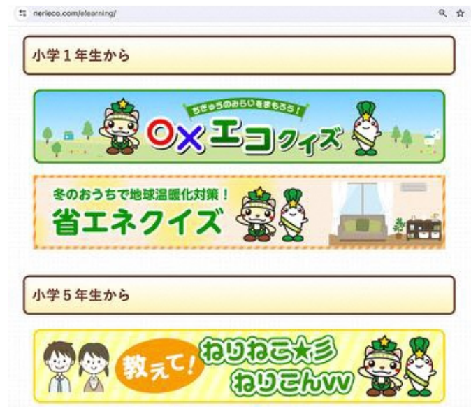
「ねり☆エコ e-ラーニング」

小口「ホームページ内にe-ラーニングのコーナーもあり、子ども向けの中でも、小学1年生からと小学5年生からと対象をキメ細かく設定しています。おとな向けもあります。また、動画のコーナーもありますので、ぜひご覧ください。『ねりまのエコ暮らし帳』では、ふだんの生活で取り組める省エネのコツやねりまのエコな取り組みを紹介しています」