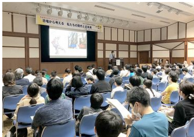
令和5年度 環境月間講演会「恐竜博士がやってくる！ 恐竜から考える私たちの現代と近未来」