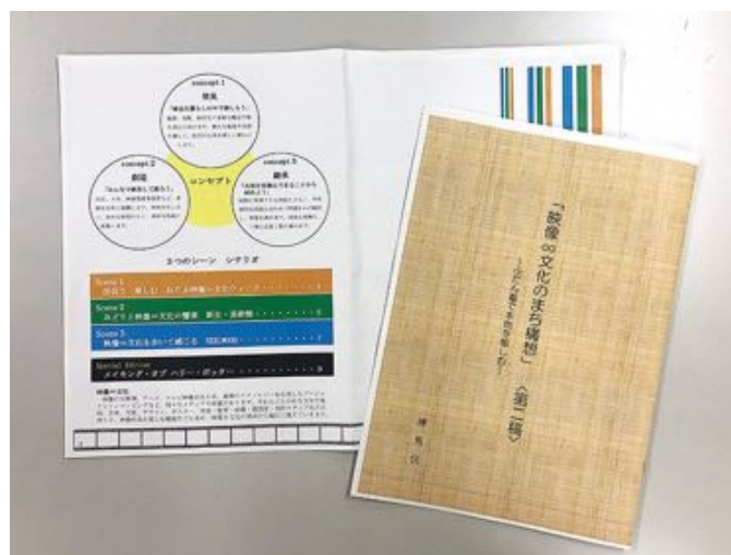
「映像文化のまち構想」

村上「はい。練馬区の多彩な映像資源に着目して、より文化的で豊かな暮らしを提案するという構想で、令和3年（2021年）11月、『映像文化のまち構想』を策定しました。それに沿って、令和4年（2022年）10月にサイトリニューアルを行い、現在のような形になりました」