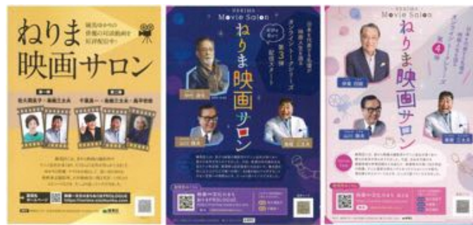
「ねりま映画サロン」のチラシ。「映像文化のまち ねりま」サイト内で動画を公開中！

村上「カジュアルな作りになっていて、いい意味で『区のWebサイトっぽくないね』と好評の声をいただいています。開設時はこれほど内容が多くなかったのですが、長引くコロナ禍で『ねりま映画サロン』というオンライン配信事業を始めるなど、アーカイブを蓄積してコンテンツを充実させていきました」