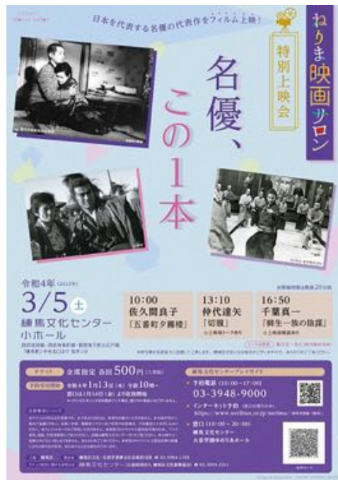
練馬文化センターで開催した「ねりま映画サロン 特別上映会」。「五番町夕霧楼」「切腹」「柳生一族の陰謀」の3本を上映しました（2022年3月）