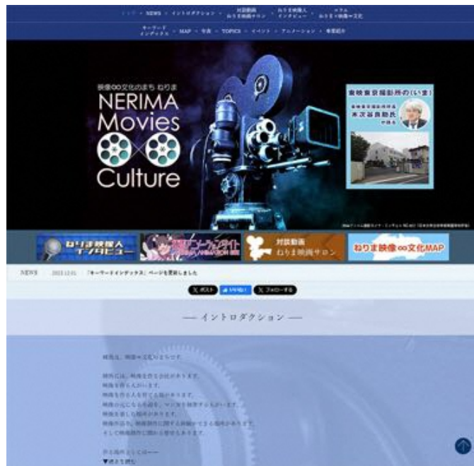
Webサイト「映像文化のまち ねりま」トップページ

―サイトに練馬と映像文化の歴史をはじめ、ゲストを迎えての対談動画やインタビュー、コラムなど、内容の充実ぶりに驚きました。反響はいかがですか？