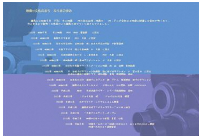
「映像文化のまち ねりま」の歩み。昭和初期から長い年月をかけて育まれてきました

村上「現在の東映東京撮影所の前身である新興キネマ東京撮影所は、昭和10年（1935年）に開所しました。戦時中に軍需工場に売却され、戦後は閉鎖していましたが、昭和22年（1947年）に太泉スタジオが設立し、昭和26年（1951年）に他2社と合併して東映東京撮影所になりました。日本大学芸術学部は昭和14年（1939年）に江古田に移転してきました。日本初の本格的オール・トーキー（発声映画）が制作されたのが昭和6年（1931年）なので、黎明期の頃から、練馬には映像制作関連の企業や施設が集まってきていたと言えます」