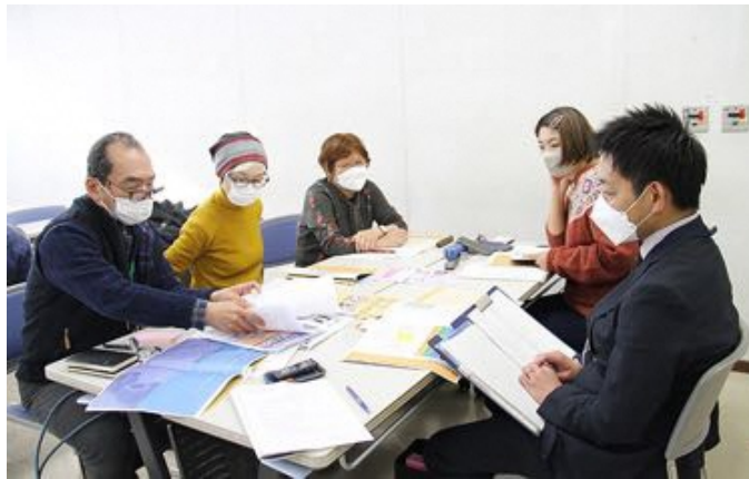
サポーターによる取材の様子。大好きな映画の話に花が咲き、脱線することもしばしば（笑）

各々の映画にまつわる思い出話、文化芸術行政へのアイデアも飛び出しました。そんな多くの人に愛される映像文化の資源が、練馬には豊富にあることが分かりました。これからも進化していく練馬の映像文化事業に注目していきましょう！