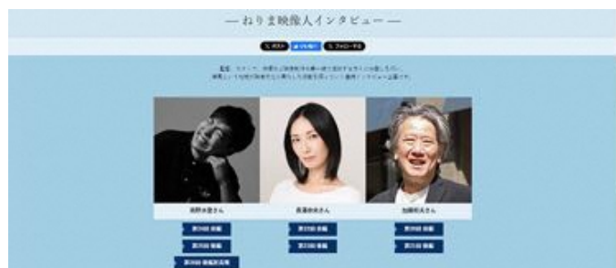
「ねりま映像人インタビュー」のコーナーでは、東映東京撮影所や東映アニメーション、日本大学芸術学部など、練馬とゆかりのある映像制作関係者の方々のインタビューを掲載しています

サイトが本格的に稼働してまだ1年半弱、もっと多くの方に見ていただけるよう、内容の充実に合わせて、広報活動もしっかり行っていきたいと思います」