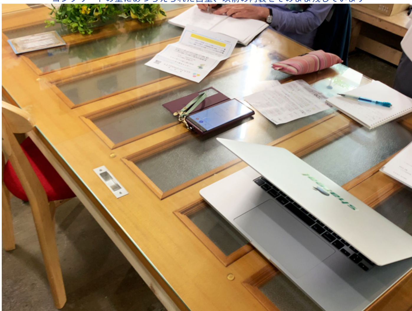
打ち合わせ中の機の天板をよく見ると、ガラスの下に取っ手が！！ドアですね