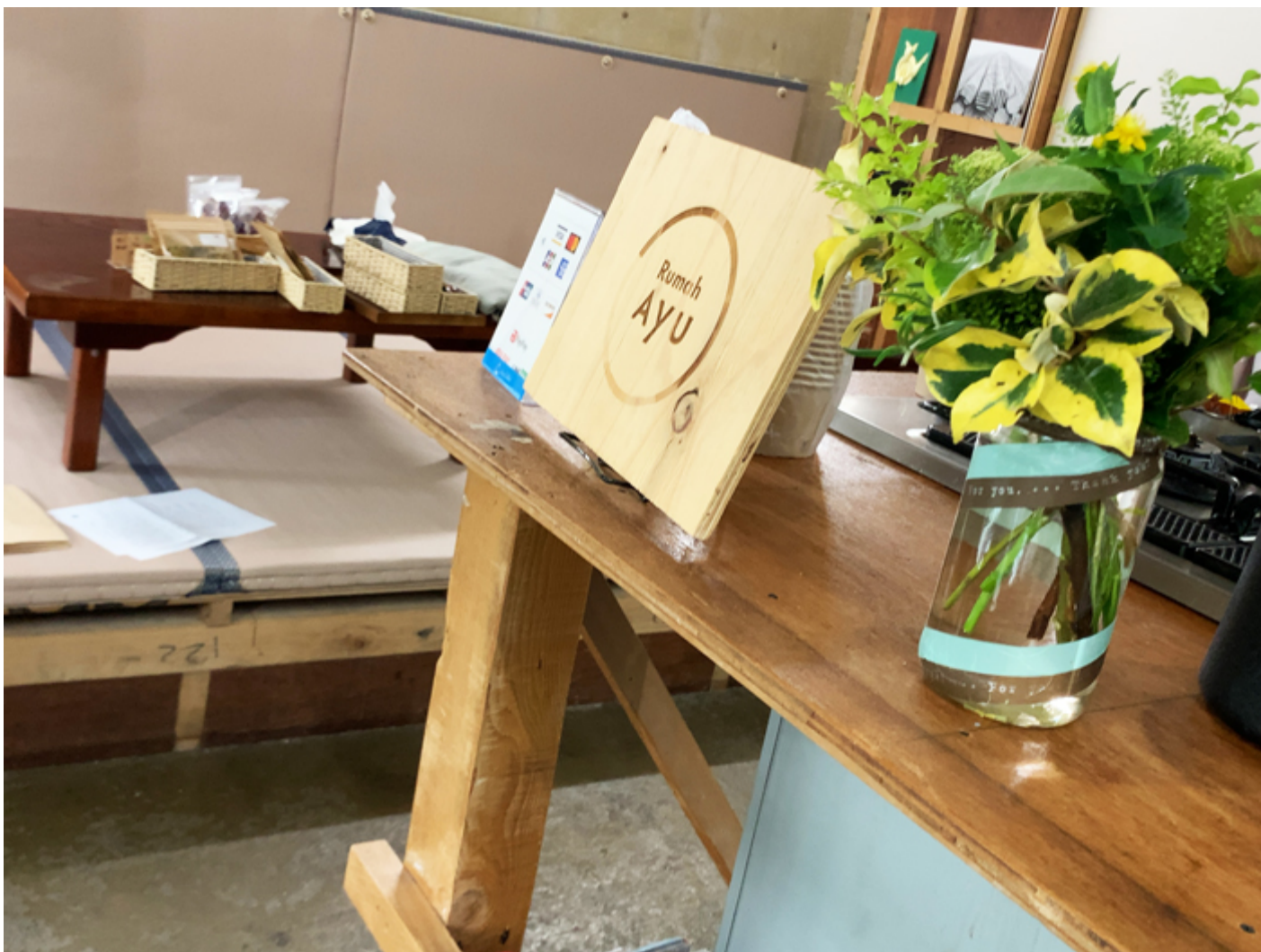
このカウンターを支える角材も廃材を利用！まさに、リユースですね