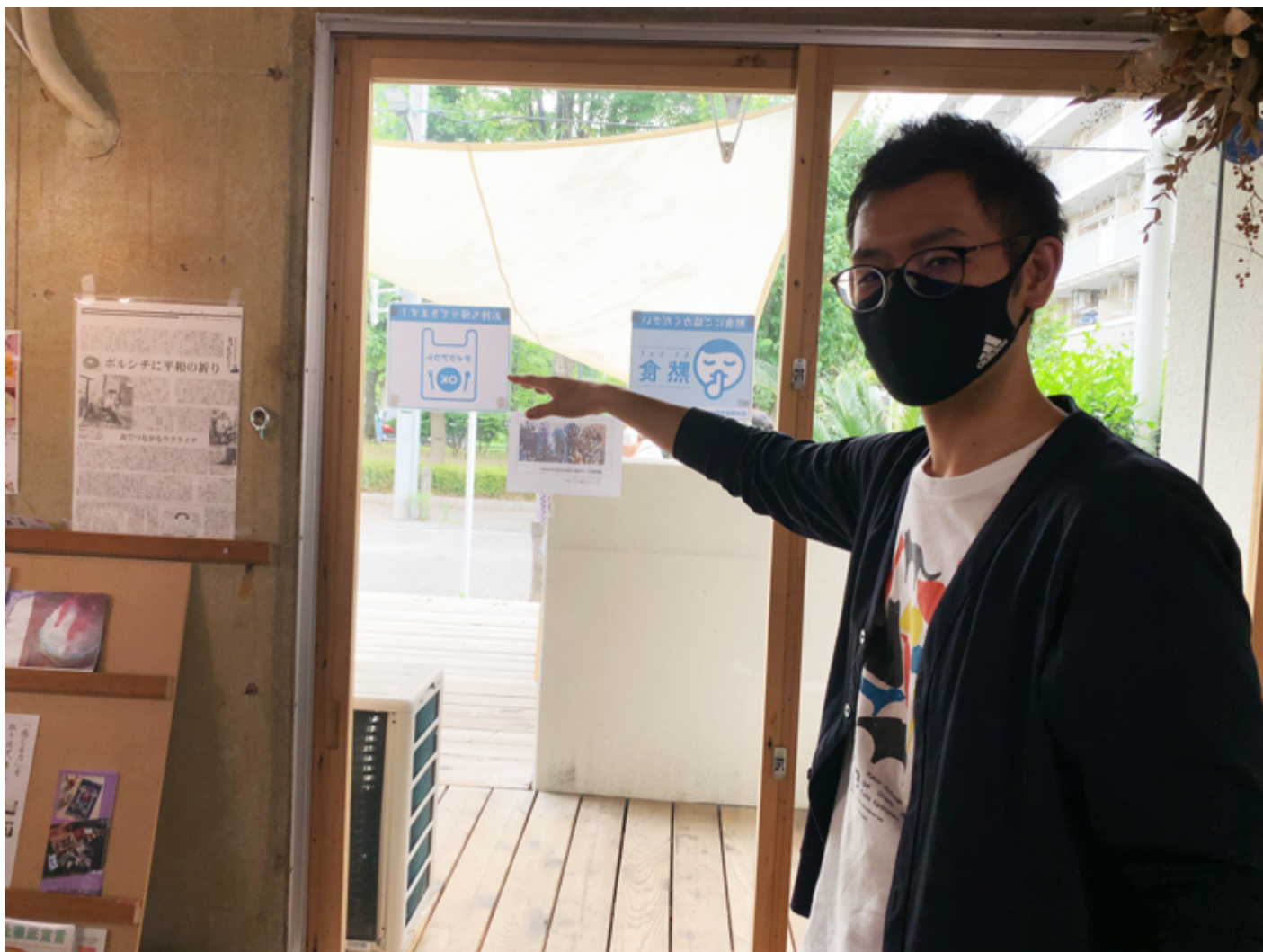
これがその、建具屋さん泣かせの出入り口です R SPACEに行って、ぜひ見てみてください

この場所は飲食店としての使用がメインですが、それだけにこだわってなくて、例えば『絵本の読み聞かせをやりたい』ですとか、ついこの間の5月末までは、鍼灸師さんがここで治療もされていました。ホームパーティーや友達とのパーティー目的での一時貸しもしていますので、中を壊したりなど、想定外の使い方さえしなければ、自由に活用していただけます。今も地元のアーティストが作品の展示をされていたり、ウクレレ教室なども開催されています」