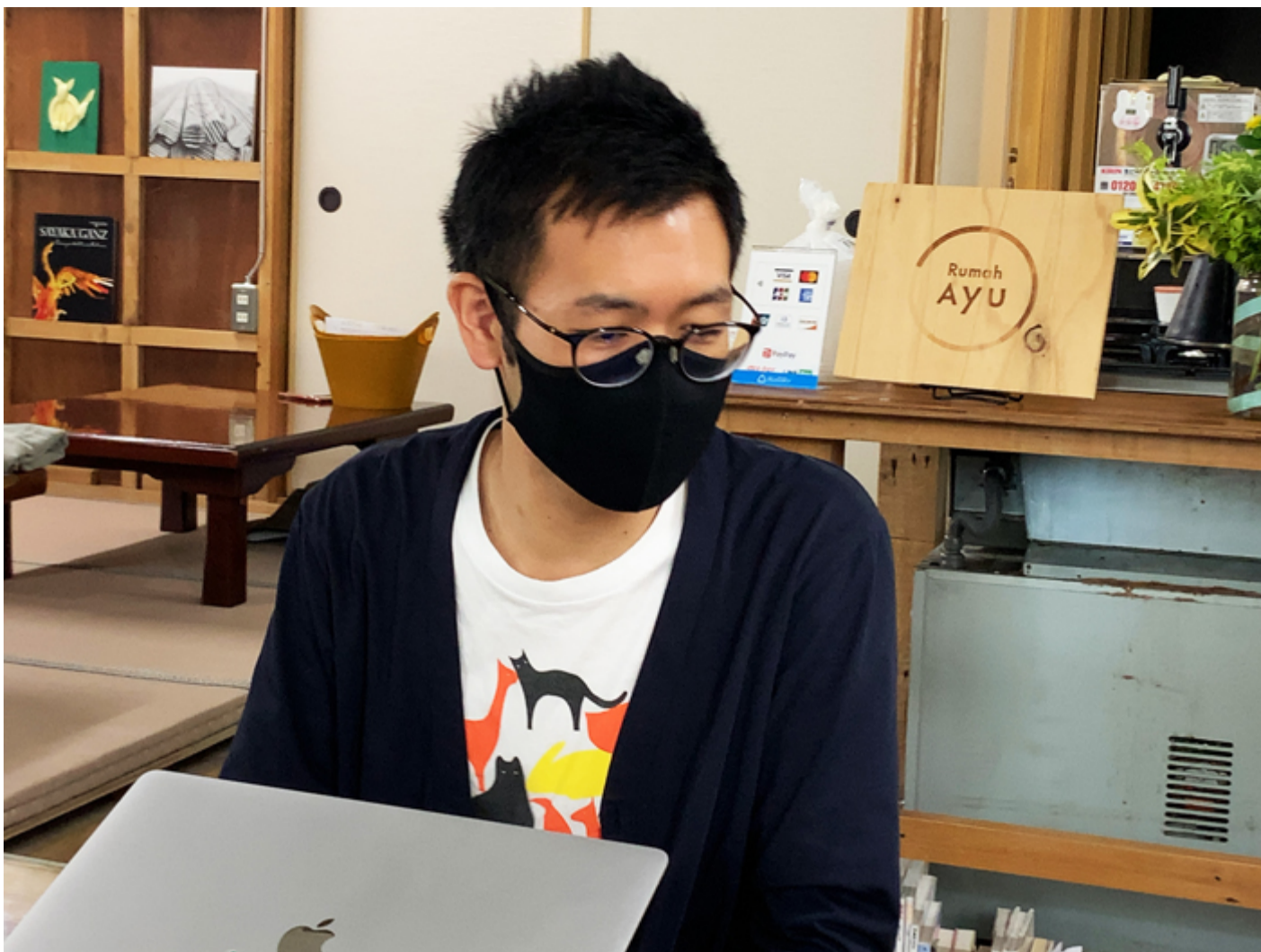
5つのR、今後の世の中のキーワードとして覚えておいて損はないかもしれませんね！

ここはシェアキッチン・シェアスペースなので“R SPACE”という名前にしており、上はシェアオフィスですから“R OFFICE（アールオフィス）”と呼んでいます。