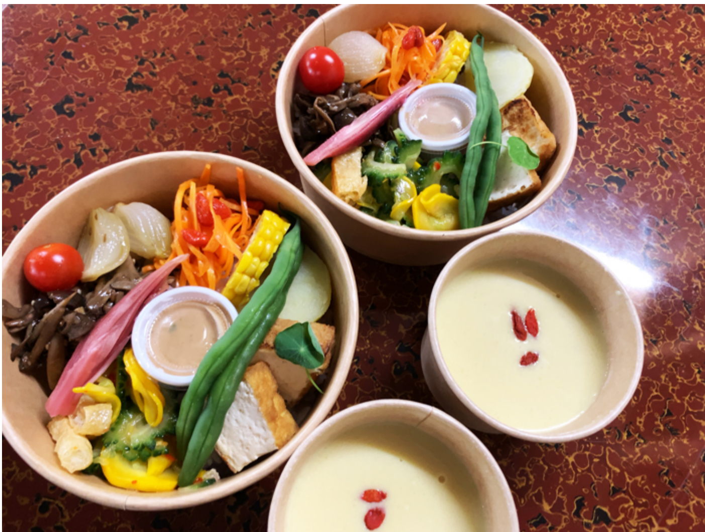
彩も鮮やかな薬膳ランチ！食べられなくなってしまうのは、残念ですね

今は、お弁当とスープのセットを1300円を出しています。これは決して安い値段ではないと思うのですが、やっぱり最初はお弁当箱とかも、資源のことや環境のことを考えるのもったいないから、しっかりした作りの曲げわっぱを使いたい、と色々考えていたんです。でもやっぱりコロナで、衛生面などから容器を繰り返して使用しない方がいい、エコでは無いけれど使い捨て容器の方がいい、という風潮もありました。これはとても難しい問題でしたね。