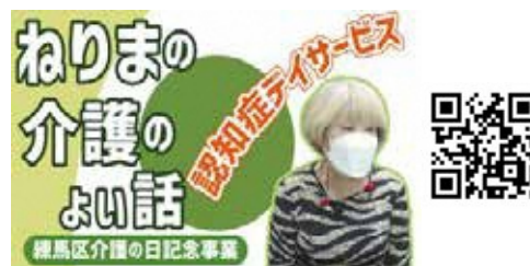
1. 認知症サービス ティ・サービス太陽