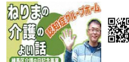
2. 認知症グループホーム ミニケアホームきみさんち