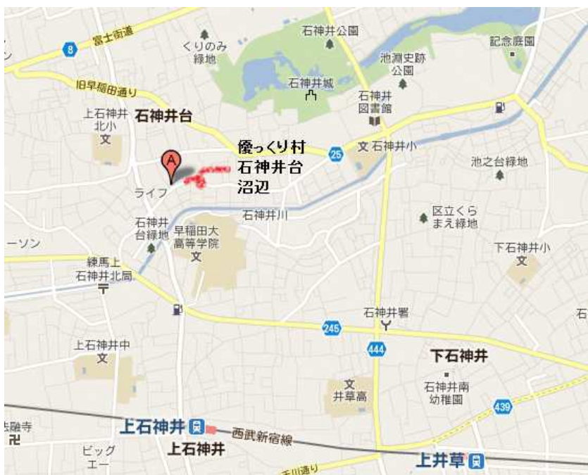
石神井公園近くです

グループホームと一緒にイベント等参加することができます。 社会福祉法人として、地域と協働しアクティブに外出したり、地域のお祭りに参加したりしていきます