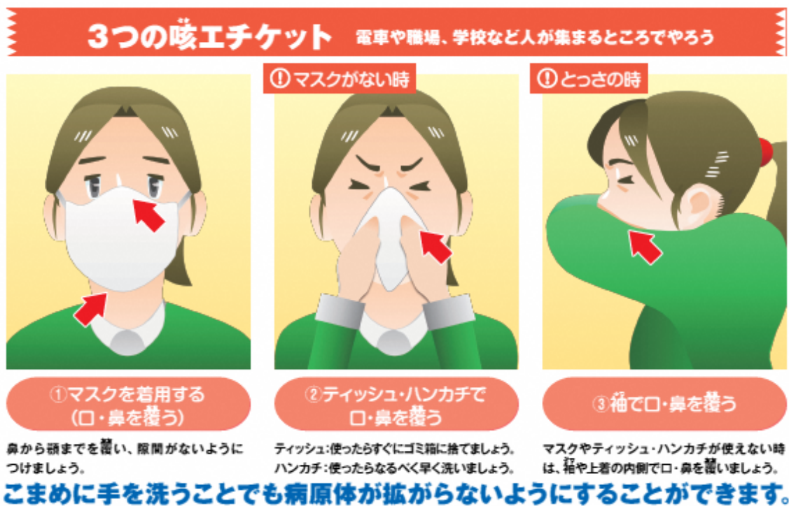
図3 咳エチケットについて