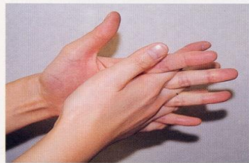
4. 指の間を十分に洗う