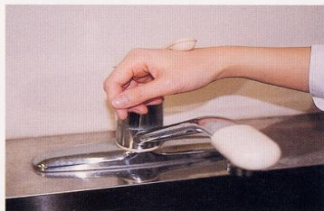
7. 水道の栓を止めるときは、手首か肘で止める。できないときは、ペーパータオルを使用して止める