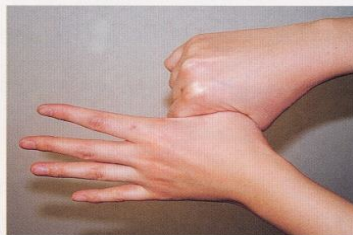
5. 親指と手掌をねじり洗いする