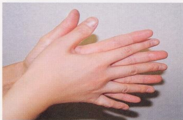
1. 手のひらを合わせ、よく洗う