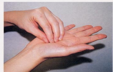
3. 指先、爪の間をよく洗う