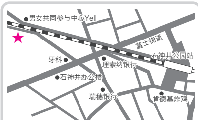
石神井保健咨询所 ☎3996-0634 练马区石神井町7-3-28 从石神井公园站西口步行7分钟