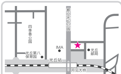
光丘保健咨询所 ☎5997-7722 练马区光丘2-9-6 (光丘区民中心1楼) 从光丘站步行1分钟