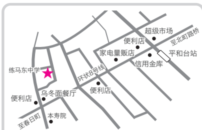
北保健咨询所 ☎3931-1347 练马区北町6-35-7 (※) 从平和台站步行7分钟