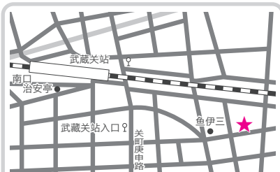
关保健咨询所 ☎3929-5381 练马区关町东1-27-4 从武藏关站南口步行7分钟 从“武藏关站入口”公交站步行5分钟 从“吉祥寺路入口”公交站步行6分钟