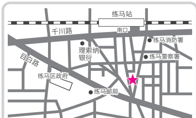
丰玉保健咨询所 ☎3992-1188 练马区丰玉北5-15-19 (丰玉健康中心内) 从练马站步行5分钟