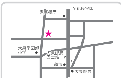
大泉保健咨询所 ☎3921-0217 练马区大泉学园町5-8-8 从“大泉邮局”公交站步行3分钟