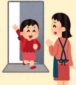
外から帰ったとき