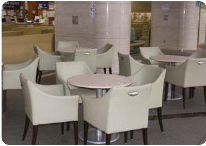
練馬区役所本庁舎アトリウム