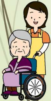
契約内容報告書 (地域生活支援事業)