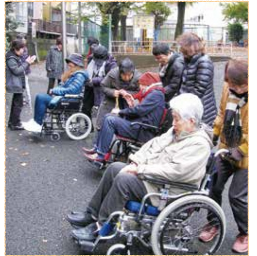
車椅子介助の勉強会の様子 ▲

小学生の塾の送り迎えをしている協力会員さんは、もう5年も続いているそうです。家族の一員のような感覚ですね。また、高齢者の方の自宅訪問の際は、お互いに会話を楽しむこともあるそうです。利用者さんと協力員さんの信頼関係がわかりますね。