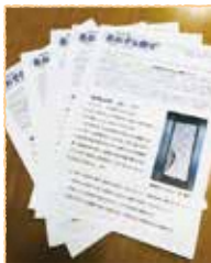
▲利用会員さん、協力会員さん、賛助会員さんの交流の場として、年に3回あおぞら便りを発行しています。

私たちと一緒に、地域の方々の生活を応援しませんか？日時や仕事場所など、無理のない範囲でできます。内容も、病院の付き添いや家事手伝い、幼稚園の送り迎えなど、資格がなくてもできるお仕事です。また、学習会を開催しており、初めての方でも経験者が丁寧にサポートしますのでご安心ください。利用者さんの「笑顔」や「ありがとう」がやりがいになると思いますよ。