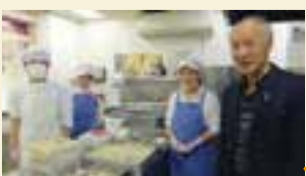
福祉工房利用者がお店を切り盛りしています