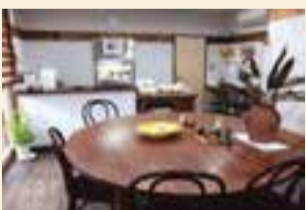
円形のテーブルがある店内