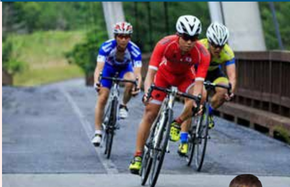
第23回夏季デフリンピック※競技大会 日本代表（自転車競技）