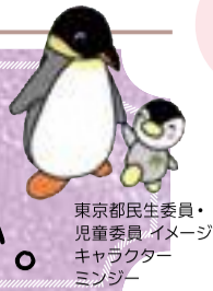
東京都民生委員・児童委員イメージキャラクター「ミンジー」

東京に民生・児童委員が誕生して100年。 これまでも、これからも、 こんなときにご相談ください。