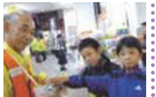
赤い羽根募金活動の様子