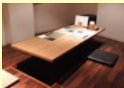
掘りごたつ式の座敷