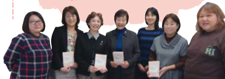
向山貫井民生児童委員協議会マップ委員会のみなさん

アンケートを行い、災害時の一口メモや困ったときの相談先情報も載せることにしました。民生・児童委員の視点でまとめた「すまいるマップ」。発行は3月の予定です。