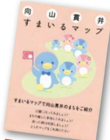
平成23年3月発行 「向山貫井すまいるマップ」

今年は、「練馬区やさしいまちづくり支援事業」の助成を受けて、公園遊具やまちなかのトイレ状況を調査、また、保育園や近隣住民などにアンケートを配り、子育て中の方の声を集めました。