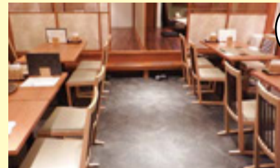
通路が広くとられた店内

和食のお店「旬菜 瀬喜美(せきみ)」さんは、店舗を作る段階から、いろいろな方が使いやすいようにと考えて設計をしたそうです。車いすに乗ったままでも利用しやすいように、カウンターやテーブルの高さを工夫しました。テーブルとイスは全て移動できるので、お客様が使いやすいように配置を変えられます。広々とした手すり付きのトイレには、ベビーカーと一緒に入ることもできます。座敷は間仕切りを使うと個室にもできるので、子どもと一緒に安心して食事を楽しめます。