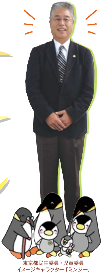
東京都民生委員・児童委員 イメージキャラクター「ミンジ」

民生・児童委員同士だけでなく、町会や学校、保健相談所や福祉事務所など、区の様々な機関と連携していますので、きっと一緒に解決策を見つけられると思います。